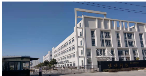
葉縣偉強科技有限公司