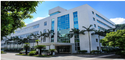
中山偉強科技有限公司